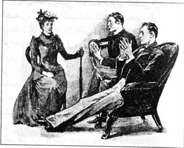
Sydney Paget 1892

لاحظت أن هولمز قد أعجب بأسلوب عميلته الجديدة، فقد نظر إليها بتفحص كعادته، ثم أرخى جفنيه وجمع أطراف أصابعه معاً ليستمع إلى قصتها.