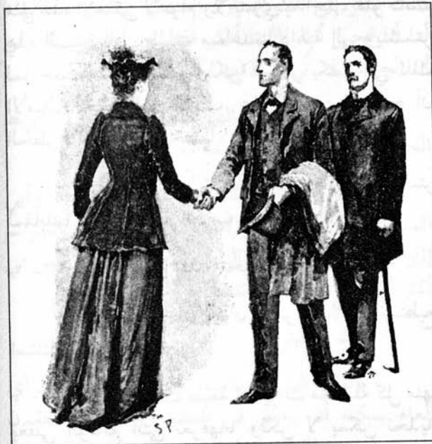
Sydney Paget 1892

قالت بامتنان: إنني سعيدة جداً بقدمكمما، هذا