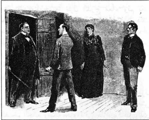
Sydney Paget 1892

لم تكّد الكلمات تخرج من فمه حتى ظهر بالباب رجل بدين ضخّم الجسم وفي يده عصا، فصرخت الأنسة هنتر حين شاهدته وانكلمت عند الجدار، ولكن شيرلوك هولمز وثب إلى الأمام وواجهه قائلاً: أيها الشريك، أين ابنتك؟