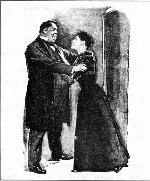
Sydney Paget 1892

ولكنه غالى في إظهار تملقه وظهر ذلك في نبرات صوته، ولذلك أخذت حذري منه فأجبت قائلة: لقد دخلت إلى الجناح الخالي لحماقتي، ولكنه