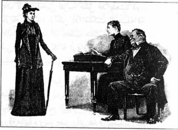
Sydney Paget 1892

- كنت أتقاضى أربعة جنيهات في الشهر عندما