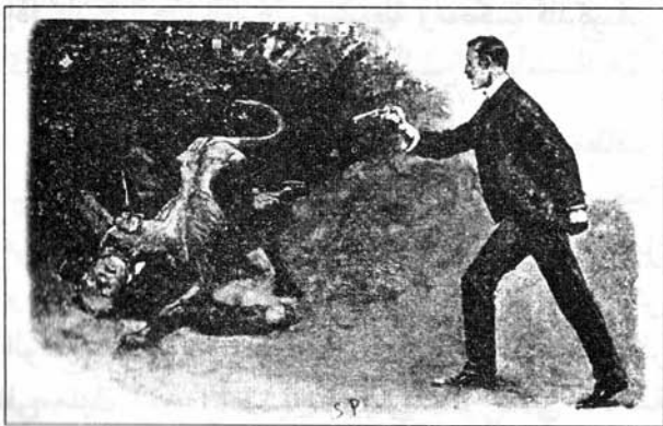
Sydney Paget 1892

- نعم يا آنسة، لقد أطلق السيد روكاسل سراحي حين عاد وقبل أن يصعد إليكم. آه يا آنسة، من